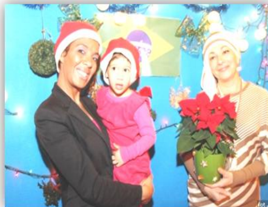
Kiermasz kultur zorganizowany w ramach projektu „Nowa Przystań” (15.12.2012r.)